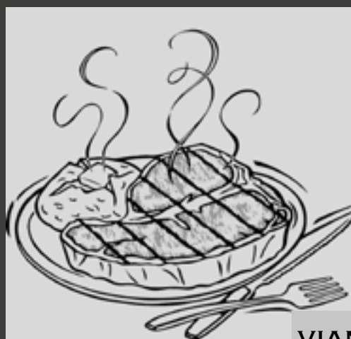
VIANDES / BURGER