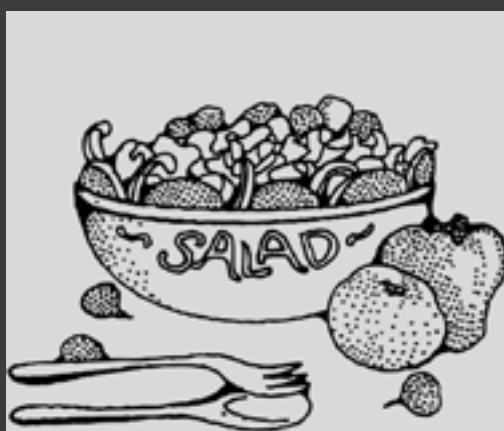
SALADES / WOKS